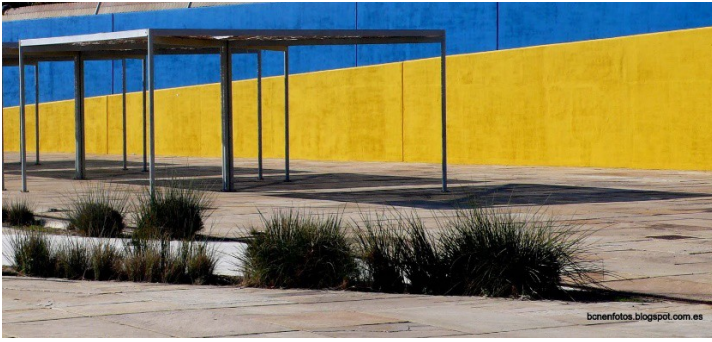
AREES DE OMBREIG. Arbres o pèrgoles /elements de