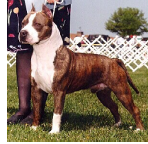
American Staffordshire Terrier