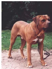
Tosa Inu (Tosa Japonès)