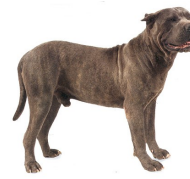
De presa Canari