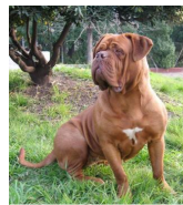
Dog de Burdeus