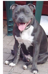
Staffordshire Bull Terrier

RACES CONSIDERADES POTENCIALMENT PERILLOSES