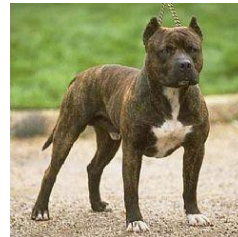
Pit Bull Terrier